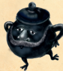
Ergonominen pata 65 kuuplootua, 30 loihutuäryityistä