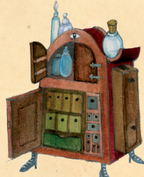
Jauhelokerikko 40 kuuplootua

Rasittuuko selkä noidanpadan hämmentämisestä? Ovatko seinät nokiset? Onko loihutupöytä kaikkialla? Ovatko jauhereseptisi aina hukassa? Kierivätkö jauhepullot pitkin lattioita? Tuunaa kammiosi sisustussuunnittelijan uusimmilla vinkeillä!